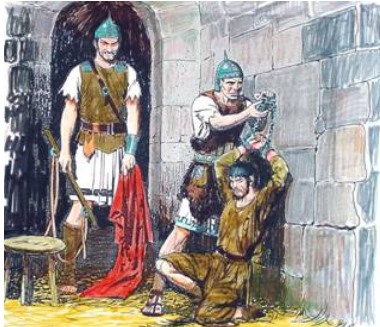
Pintura por Joe Maniscalco. (Derechos reservados. http://biblical-illustrations.com )

3. Reflexionando sobre la permanencia en la tierra de los "diez cuernos" después de ser conquistados por Cristo, incluso durante el Milenio, entendemos que esto es importantísimo, aun imprescindible, para así mantener inviolable la libertad religiosa hasta el tiempo determinado por Dios . Ni siquiera durante el Milenio faltan elementos, mayormente de corte ateísta, humanista o hedonista, cuya agenda es trabar esta libertad. Y siempre por ahí está la jerarquía de la Iglesia Católica Romana, con su grandiosa pretensión de ser "la única religión o iglesia con derecho de existir", a la expectativa de oportunidades para imponer su imperiosa voluntad al respecto.