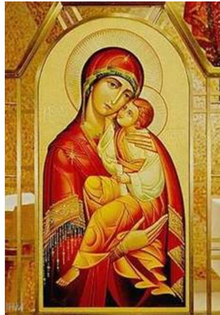
¡Aun visten a la “Virgen María” y el “Niño Jesús” de “púrpura y escarlata”. www.flickr.com www.bringyou.lo-apologetics.com