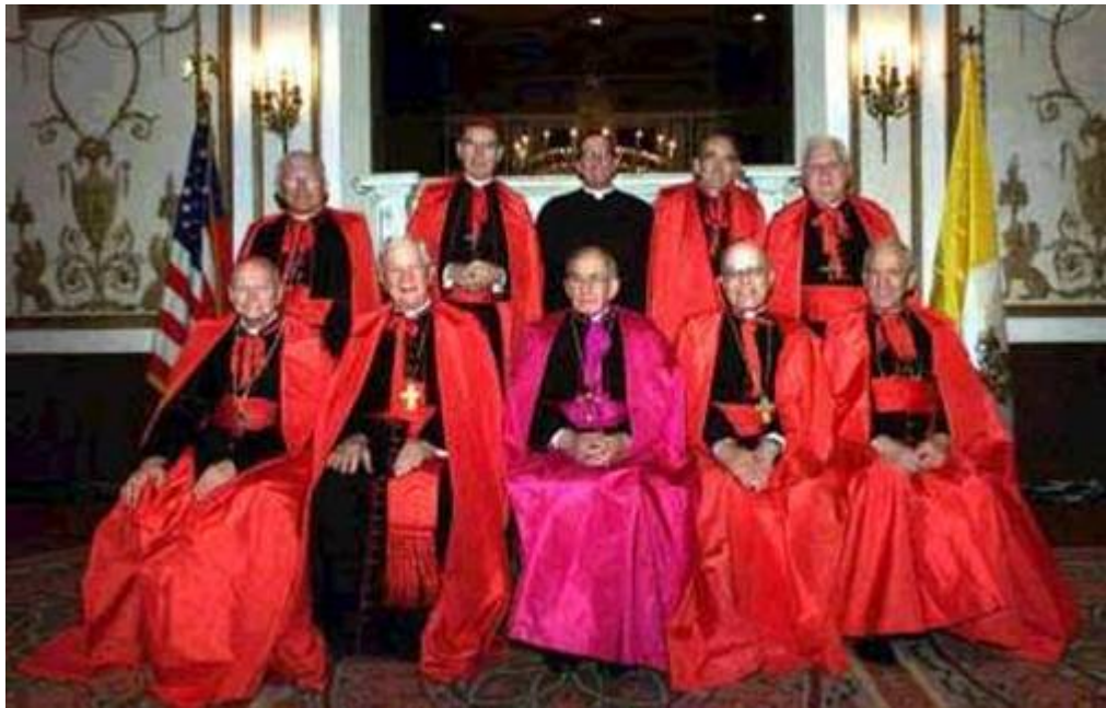
Prelados católicos romanos ostentando lucidas vestimentas de escarlata, púrpura y negro.